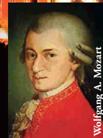
Wolfgang A. Mozart

Das Schwetzingen Schloss und der berühmte Garten sind aus dem zentralen Blickwinkel des Hirschgruppenbrunnens eine ideale Kulisse um Festliches und Prunkvolles zum Ausdruck zu bringen. Für das brillante Boden- und Höhenfeuerwerk übernimmt wieder der internationale Pyrokünstler Renzo Cargnelutti der Gruppe Art & Fire die feuerdramaturgische Inszenierung, bevor der Abend traditionell mit Elgars Pomp and Circumstances March Nr. 1 im Schwetzingen Schlossgarten ausklingt. Um eine solches nach der Orchesterpartitur und der Interpretation des Dirigenten abgefeuertes Lichtspektakel zu inszenieren, ist viel Erfahrung und Vorbereitung nötig. Denn das kostspielige Ereignis , kann nur einmal, nämlich am Konzertabend selbst abgefeuert werden. Werden Sie also Zeuge dieser beeindruckenden pyrotechnischen Installationen am Boden in Kombination mit einem prächtigen musikalischen Feuerzauber am Himmel über dem Schwetzingen Schlossgarten.